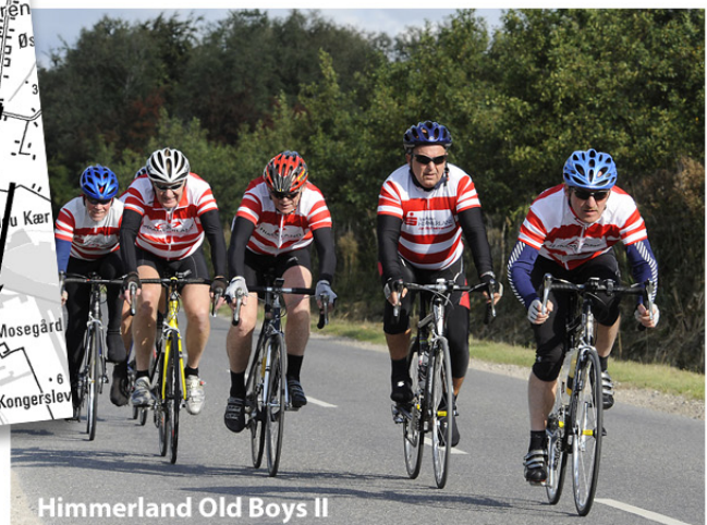
Himmerland Old Boys II